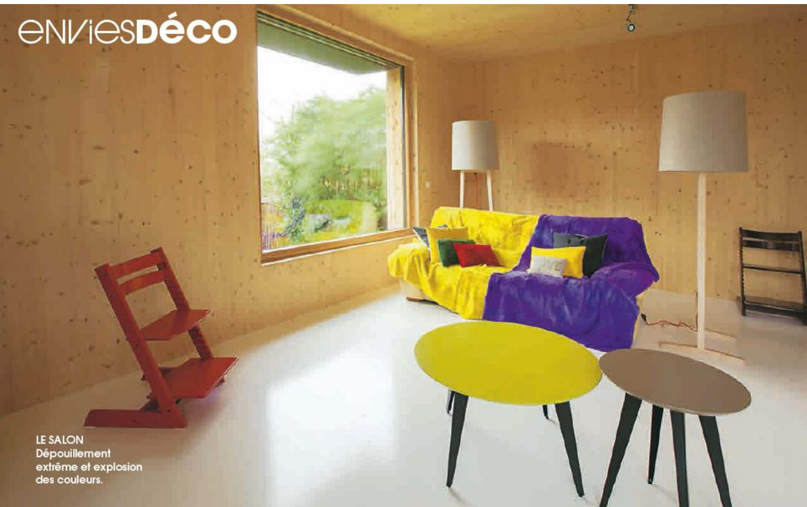
LE SALON Dépouillement extrême et explosion des couleurs.